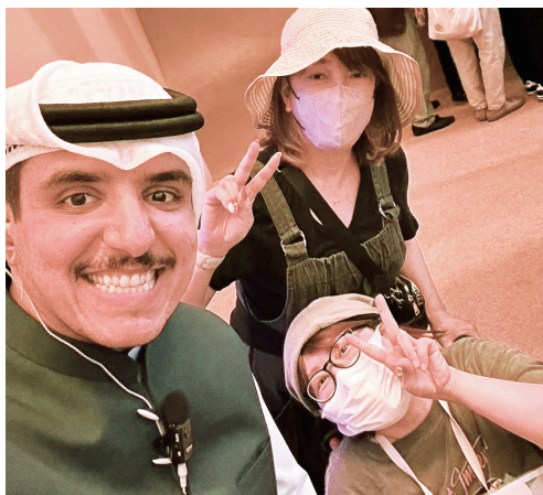
がん友(写真右下)と一緒に万博クウェートパビリオンにて行った大阪関西

手術後の数年は、生き急いでいました。「早く術後〇年になってほしい」「〇年生きたという証がほしい」そんな区切りの数字に、すぎるような気持ちでした。無理をして行動範囲を広げ、「これだけ動けるのだから大丈夫」と自分に言い聞かせる日々。今振り返ると、ずいぶん頑張りすぎているのだと思います。