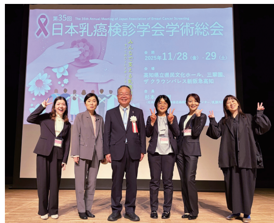
日本乳癌検診学会学術総会の市民公開講座の後でスタッフたちと

医2名と乳癌看護認定看護師1名が中心となって、院内のさまざまな職種のひとたちに対する教育・啓発を行い、多くの診療科、多職種の皆さんと共同して、また、院外から非常勤で緩和ケアや画像ガイド下針生検を行う医師たちやリンパ浮腫療法士(看護師)の支援を受けてさまざまなニーズに応えることのできるチーム医療を実践しています。