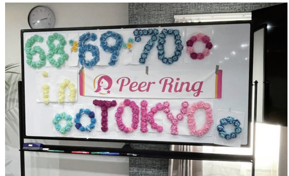
SNSの同世代オフ会の会場模様と写真