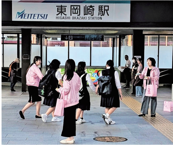
名鉄駅前啓発チラシ等を配布(愛知東支社職員)

朝日生命保険相互会社(東京都新宿区、石島健一郎社長)は1888年創業の長い歴史を誇り、現在58支社554営業所、職員4179人、営業職員15008人(いずれも25年4月1日)体制で業務を展開。「まごころの奉仕」を基本理念とし、社会貢献活動に力を入れており、「多彩な社会貢献・文化支援」の実績を築いていらっしゃいます。09年2月にJ.POSHのオフィシャルサポーターに登録され、社会との共生を目的とした「社会貢献」の1つに「ピンクリボン運動」を掲げ、毎年全役職員から募った醸金(きよきん)をJ.POSHに寄付して頂いているほか①啓発チラシ配布、店頭ポスター提示②啓発グッズ社内あっせん③顧客向けセミナー開催④同社ホームページでピンクリボン運動の紹介…など幅広い啓発活動が続けておられます。