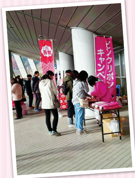
◀ 12月1日 第33回ちびっこ健康マラソン大会 エディオンスタジアム(広島広域公園)にて プレステケア・ピンクリボンキャンペーン 広島実行委員会