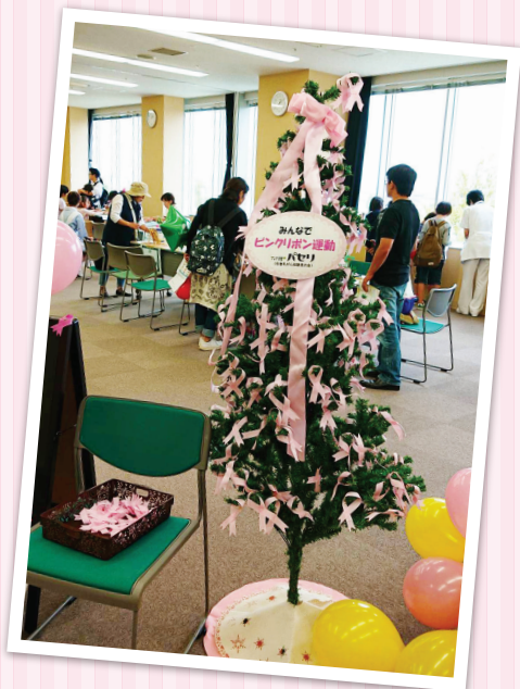
女性元気応援団 もものわ 10月28日の子どもフェスタにてJ・POSHの Tシャツを着て活動しましたのご報告