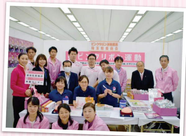
▲ 11月10日ピンクリボン・ミニウォークin埼玉 にて