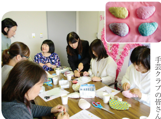
手芸クラブの皆さん

会則は第1条「乳房にかかわる疾患により乳房を喪失または、それに準ずる手術を受けた人を以て結成」から始まり、「会員の病後の人生がより良いものとなるよう活動。乳がん死撲滅のための啓発を行う」、「乳腺疾患患者を正会員とし、医療関係者及び協力者を賛助会員とする」など10ヶ条があります。2017年度の主な活動は、会報「すずらんtimes」2回発行、食事会、手芸、おしゃべり会開催など。すずらん会だけではなく、よっかいちキャン