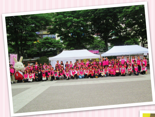
5月13日「第3回福島市ピンクリボン街頭キャンペーン」 福島市保健所健康推進課