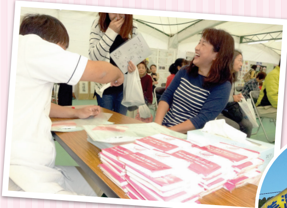
◀ 美濃市立美濃病院さん みの健康フェア 11月10日、11日 美濃運動公園において 第43回美濃市産業祭と同時開催