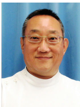
市立ひらかた病院 泌尿器科 主任部長