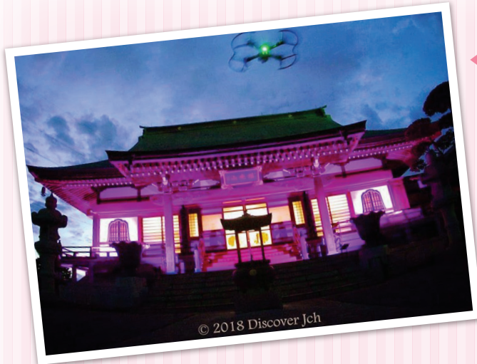
◀ オフィシャルパートナーの川越市 最明寺さんのお寺のライトアップです。10月1日～28日