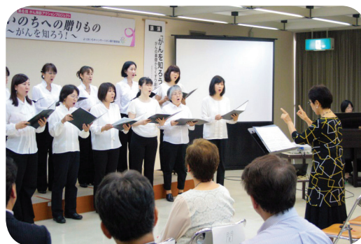
がん啓発イベント

サーリボン実行委員会(構成団体=すずらんの会、四日市看護医療大学、四日市羽津医療センター、全国健康保険協会三重支部、四日市市健康づくり課、NPO法人ワークスタイル・デザイン)への協力、県がん相談支援センターおしゃべりサロンNPO法人ワークスタイル・デザインとの協働——など三重県、四日市市と官民協働の活動を行っています。