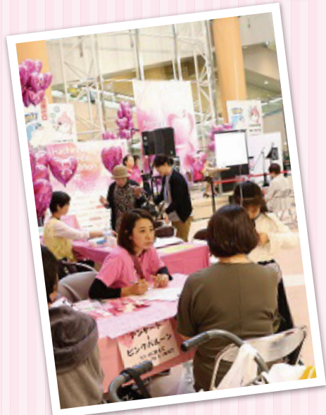
◀ 10月13日 八戸&青森ピンクリボン プロジェクト2018にて 八戸ピンクリボンプロジェクト実行委員会