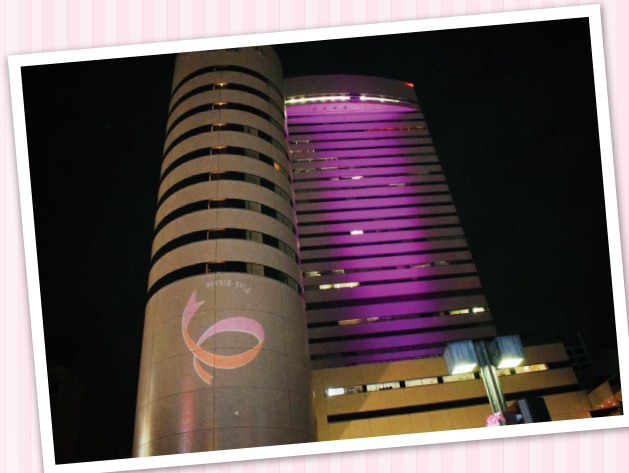
大宮ソニックシティのライトアップ