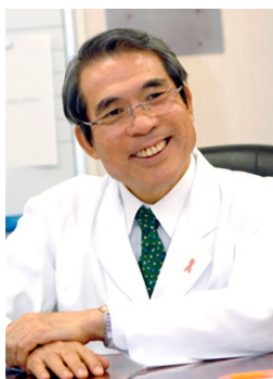
認定NPO法人 乳房健康研究会 理事長