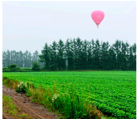
北海道の大地に浮かぶ『りぼんちゃん』(8月 北海道バルーンフェスティバル)

私たち上士幌ガールズバルーンクラブは今年の2月に結成した全国でも珍しい、道内では唯一の女性のみで構成された熱気球のクラブチームです。活動を応援したいという町内企業のご支援のもと、8月に熱気球を持つことができました。気球はピンク色、そしてワンポイントにハートのリボンをつけています。愛称は町民限定で公募し、5歳の女の子に「りぼんちゃん」と名付けていただきました。私たちは、この可愛らしく女性らしい熱気球とともに、単に競技に参加するだけでなく、明るく元気に輝く女性を応援したいという思いを持っていました。