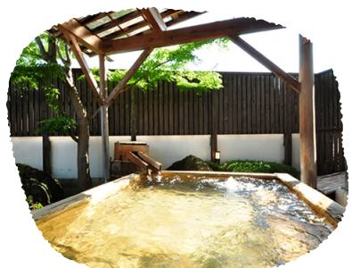
③栃木県 かんすい苑 寛榮