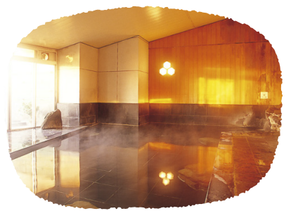
⑩大阪府 ホテルセイリユウ