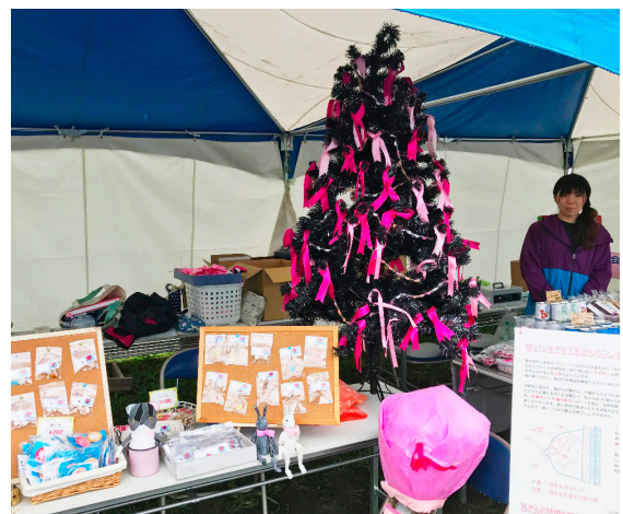
ピンクリボンツリーやパネル掲示、グッズを作成して啓発活動を行う様子

飾り、気球をイメージしたカンパッチやピンパッチ、Tシャツ、アクセサリ等オリジナルグッズを作成。お買い上げいただいたお客様には、啓発用のティッシュを配布し、売り上げの一部はJ.POSH様へ寄付することにしました。会場では「実は私も乳がんで手術をしたのです。こうして活動してくれてうれしいです。」と応援の言葉をかけてくださる方もいらっしゃいました。