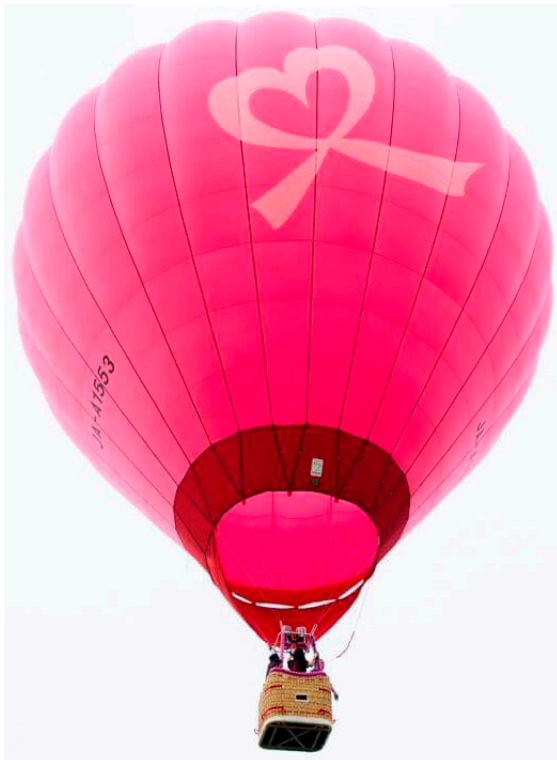
可愛らしいハートのリボンをつけたピンクの熱気球『りぼんちゃん』

ちょうど上士幌町では、女性がん検診普及啓発キャンペーン事業を開始して3年目を迎え、徐々に乳がん検診の受診率が上昇しています。何か女性らしさを生かしたクラブ活動として支援できることはないかと考え、8月に町内にて開催される北海道バルーンフェスティバルで、乳がん検診の普及啓発活動を行うことに決めました。会場では、乳がんのパネルやピンクリボンのツリーを