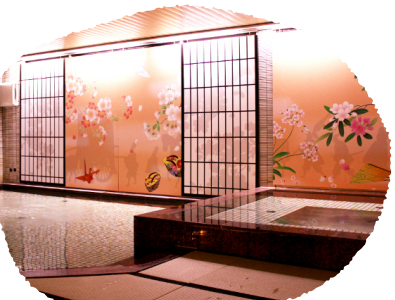
⑨愛知県 【女性専用旅館】姫宿 花かざし