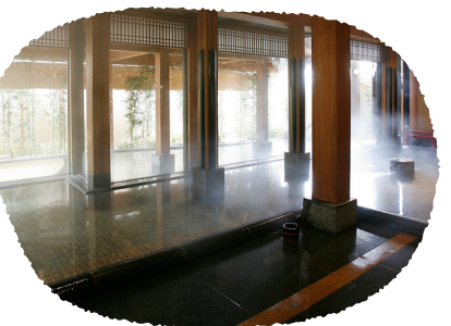
⑪鳥取県 三朝薬師の湯 万翠楼