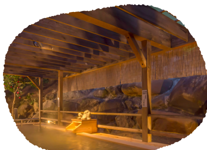
②栃木県 益子館 里山リゾートホテル