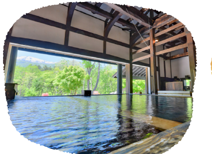
⑦長野県 ホテルシエラリゾート白馬