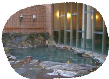
①秋田県 からまつ山荘 東兵衛温泉

キャンペーンについての詳細はJ.POSHのホームページからもご覧頂けます( http://www.j-posh.com )