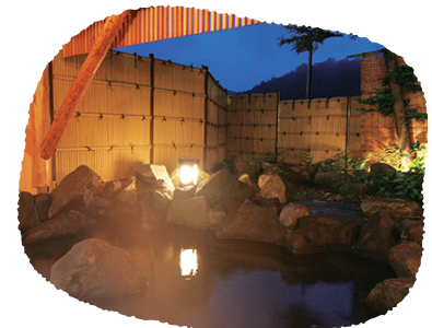
⑥長野県 ホテルタングラム