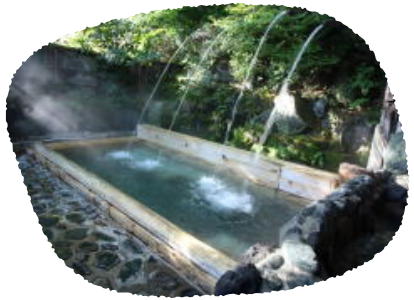
④栃木県 奥那須・大正村 幸乃湯温泉