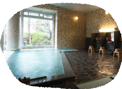
⑤長野県 浅間温泉 富士乃湯