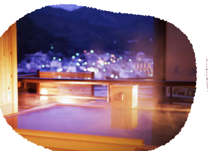
⑧岐阜県 下呂観光ホテル