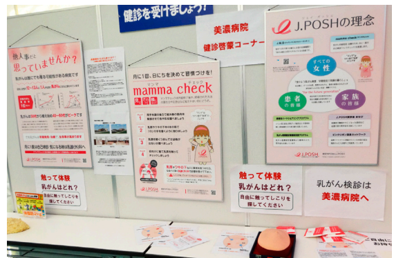
美濃市立美濃病院さん 美濃市産業祭会場にて