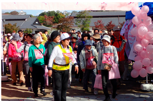
ピンクリボンキャスルウォークinひめじのスタート

がん検診に力を入れている姫路市保健所は、今年度は乳がん検診の受診率の向上を目指し、ピンクリボン月間である10月に「姫路城ピンクリボンライトアップ」のほか、市内の医療機関に「J. M. S (ジャパン・マンモグラフィ・サンデー)」の日に市民乳がん検診を行うことを呼びかけ、10月18日に3医療機関で実施されました。また、10月31日には姫路城周辺を散策する「ピンクリボンキャスルウォークinひめじ」(約170人が参加)などのイベントを実施されました。