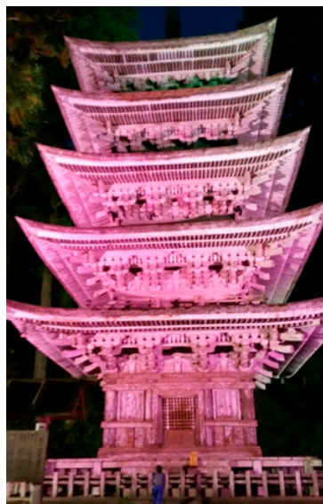
国宝「羽黒山五重塔」