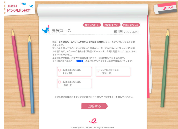
発展コース 検定画面

また、平成27年10月の乳がん月間直前に『北斗晶さんの乳がん報道』があり、このころには、「発