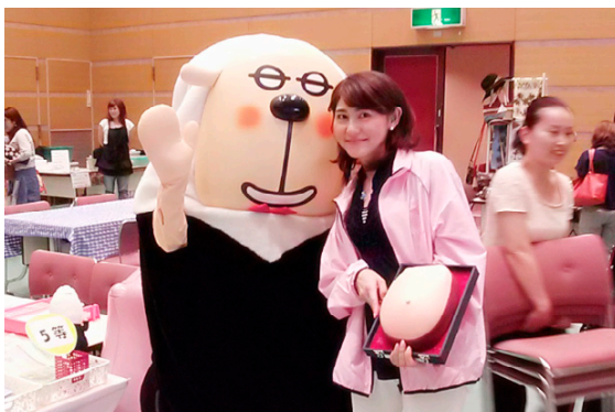
(株)東海日動パートナーズ九州 福岡支店さんの啓発イベント