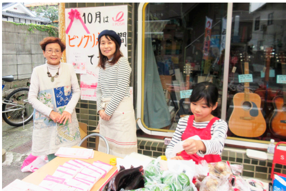
東広島市 酒祭りにて