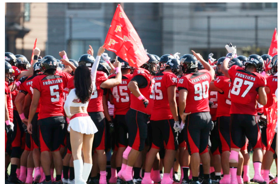
富士通フロンティアーズさんピンクリボンの象徴の「ピンク色」のテーピングと募金活動