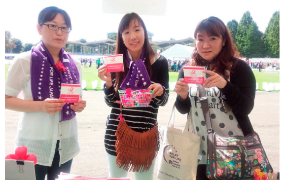
リレーフォーライフジャパン 2015とちぎ 栃木プレストケアナース研究会さん

ピンクリボン月間での啓発ティッシュを配布いただきありがとうございました。 今回は啓発パネル貸出し制度を利用された時の写真も掲載しました。