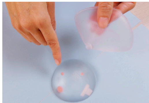
試作中の新ミニモデル