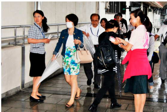
ピンクリボンウォークIN戸田市2015に向け 戸田駅前啓発ティッシュを配布