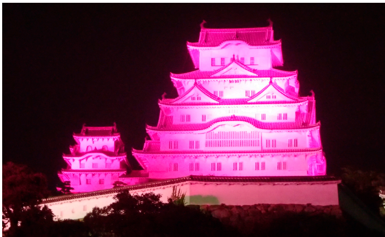
国宝・ユネスコ世界遺産「姫路城」