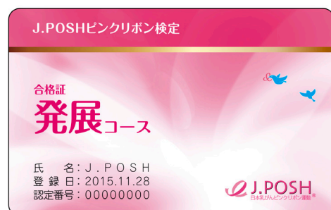
発展コース合格証カード

受験はJ.POSHホームページ( http://www.j-posh.com )まで