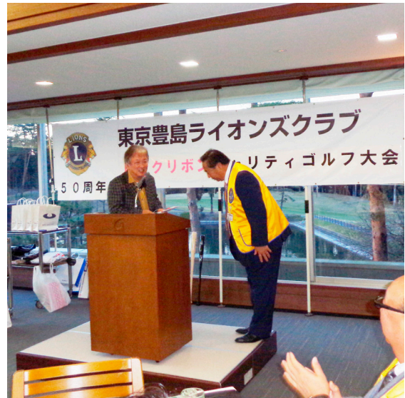
柳会長(右)から寄附金を受け取る十亀事務局長

長は日本の乳がんの実情を説明し、「頂いたご寄付はピンクリボン活動のために有効に活用させて頂きます」とお礼を述べた。