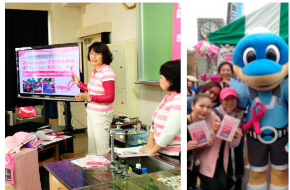
St.Mariannaしんゆりリボンハウスさん川崎市麻生区民祭りイベント会場での啓発活動風景